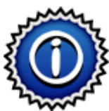
Tabela de plăți

Dați clic pentru a vizualiza combinațiile câștigătoare și plățile.